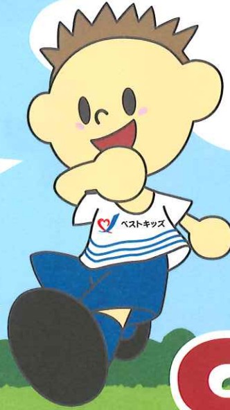
イメージキャラクター 「ジョーくん」®